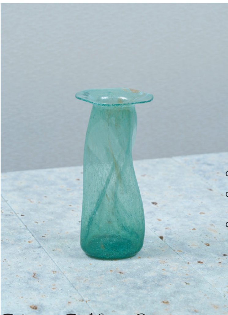
A Collection of Intriguing Designs and Crafts

"I Wish I Had Something Like This in My House"